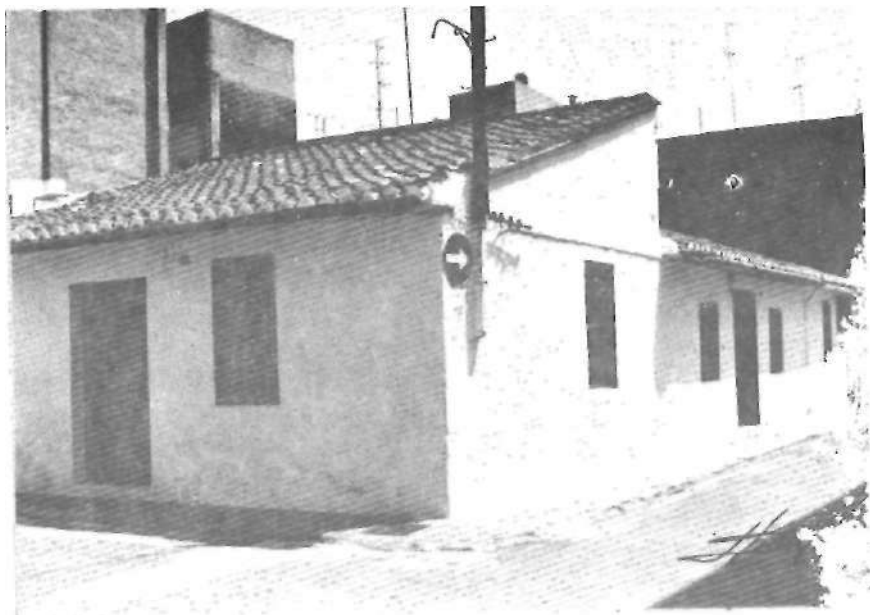
Una vista del "barrio Nou" en la calle del Olivar