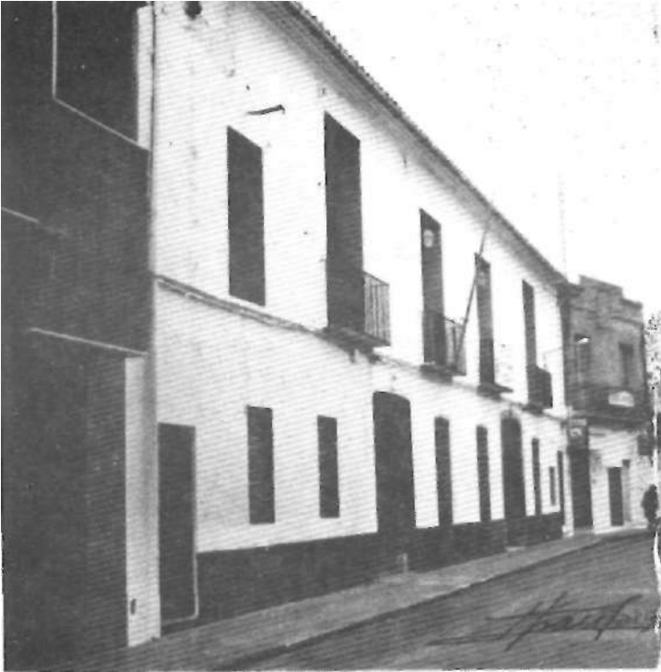
Edificio de la C/. Los Benlliure que fue sede de la Banda de Música "Vella" también llamada "la Primitiva", y más tarde del partido republicano.