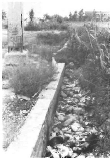
Plena de brosses, de peltret i de dexalles. La sequieta ha deixat de fer la seua funció, i una sèquia que no porta aigua, acaba sent una sèquia morta.