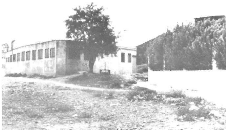
La seua eixida de la sèquia mare de Benager, era al final del carrer de Santa Cecília, tocant el terme d'Aldaia en justament comença ara la zona poliesportiva.