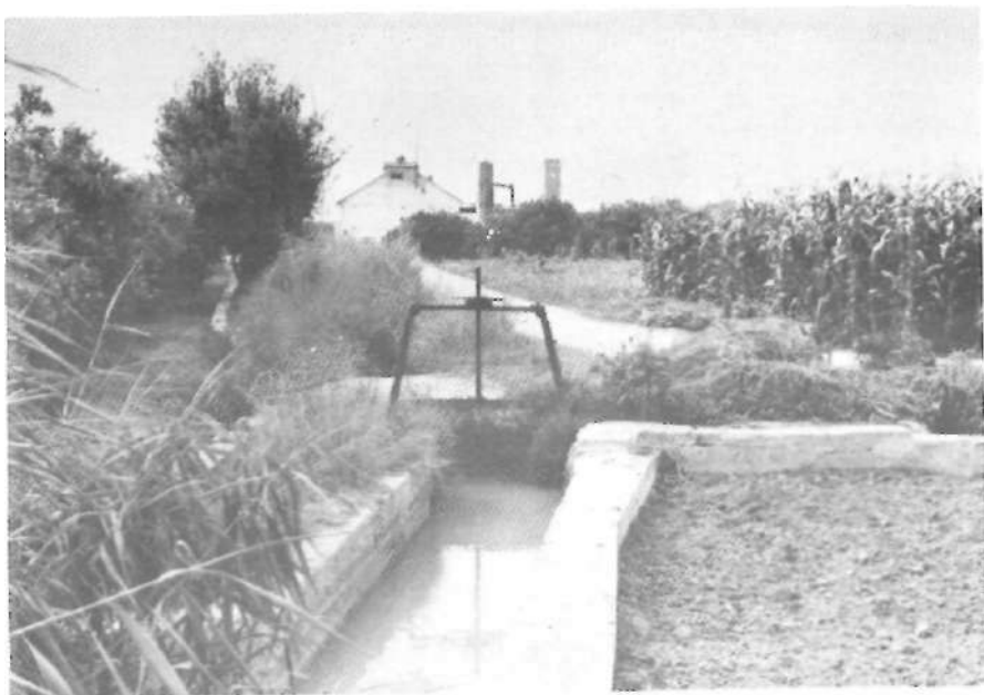
Tornava a parar a la sèquia mare, abans del motor de Sant Jaume, on comença justament el terme de Picanya.