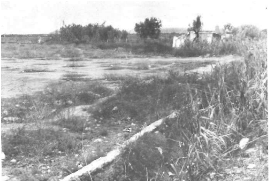
Per darrere del "Matadero" anava a parar a l'hort de Cabot.