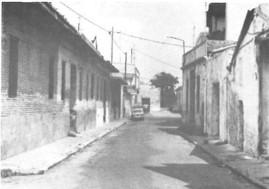
Pel carrer Santa Cecília.

La seua eixida de la sèquia mare de Bennager, era al final del carrer de Santa Cecília, tocant el terme d'Aldaia, on justament comença ara la zona poliesportiva. Voreu encara alguns senyals indicades. Anava pel carrer Santa Cecília , creuava el carrer de l'Arbre , i per darrere de ca "el tio Batiste el Blaiet" i de ca "els burros" travessava el carrer Benlliure , i es colava pel forn i per cases i corrals arribava al carrer del Centro .