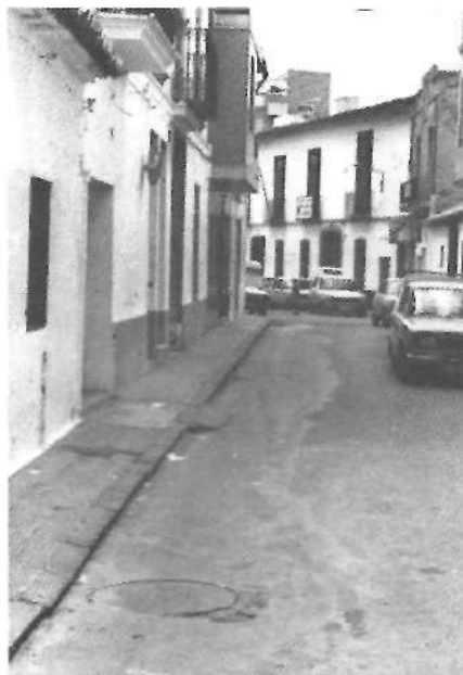
Recta pel carrer de l'Arbre i pel carrer Benlliure.