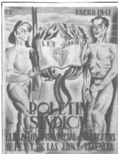
Butlletí sindical que rebien les Cambres Agràries en la dècada dels quaranta

Però els problemes reals que pateixen secularment les zones rurals des de les darreres centúries, sobretot a la nostra anèmica agri-