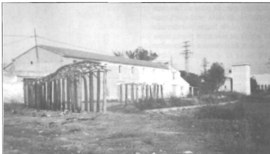
La cebera es un element incorporat al paisatge rural a principi de segle per aguarar en el seu interior la collita de la ceba. Hores d'ara, encara es conserva els restos d'una d'elles davant l'alqueria d'Alós.

El sostre era cobert de teules, amb caiguda dels vessants als costats. Rematava la teulada una filada travessera.