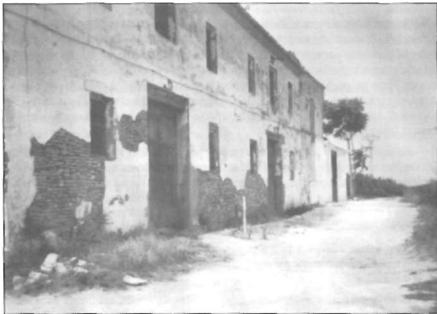
Estat actual de degradació en que s'hi troba l'Alquería de "Salvaora"

Provenen de les alqueries de l'horta on tenen petites propietats voltant la casa; parcel·les menudes que no passen de vuit o nou fanecades. Però la bonança del clima, la qualitat de les terres, produiran ingressos autosuficients.