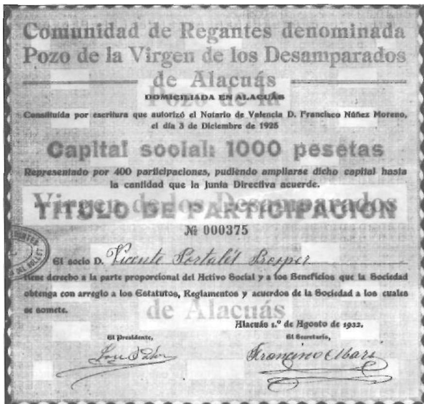
Títol o acció d'una participació del motor del Terc

L'advocació a la Verge, als sants i santes, està present en cadascun dels pous, als quals es demana la seua protecció. Trobem, doncs, al nostre abast, representada la Verge de l'Olivar, la Verge dels Desemparats tres vegades, la Divina Pastora i la Mare Sagrament. També els sants s'hi troben representats per Sant Pasqual Bailón i Sant Francesc de Paula (nom que va prendre el motor de la societat entre els diversos canvis de nom que es van succeir). El mateix Sant Vicent hi estarà representat per primera vegada (fins ara, no hi havia cap institució civil o religiosa, ni carrer, on estiguera present).