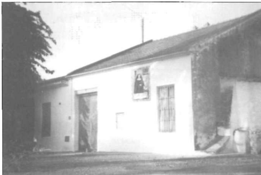
Façana del motor "de la Viuda" on s'hi pot veure el retaule de taulellets representatiu de la seua patrona La Madre Sacramento.

Amb la conversió de les terres de secà en terres de regadiu, i en posar-se en funcionament els primers pous, s'estén a poc a poc la plantació del taronger, tot i que es farà en xicotetes parcel·les de terreny d'una mitjana de deu fanecades. Les grans propietats, si existeixen, són al cul-de-sac del terme.