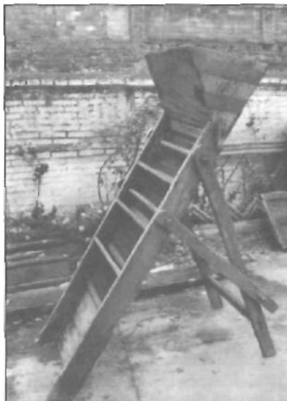
Magina del forment. Maquina que servia per a passar el gra del forment i netejar-ho de pols, mitjans, caula o cucs que caïen dins d'un llibrell que s'hi posava davall de la Magina.

A Alaquàs, l'abundància d'aigua que proporciona, des de les darreres centúries, la séquia de Benàger, amb un fèrtil reg canalitzat pel sistema de braços, ha fet possible que les partides