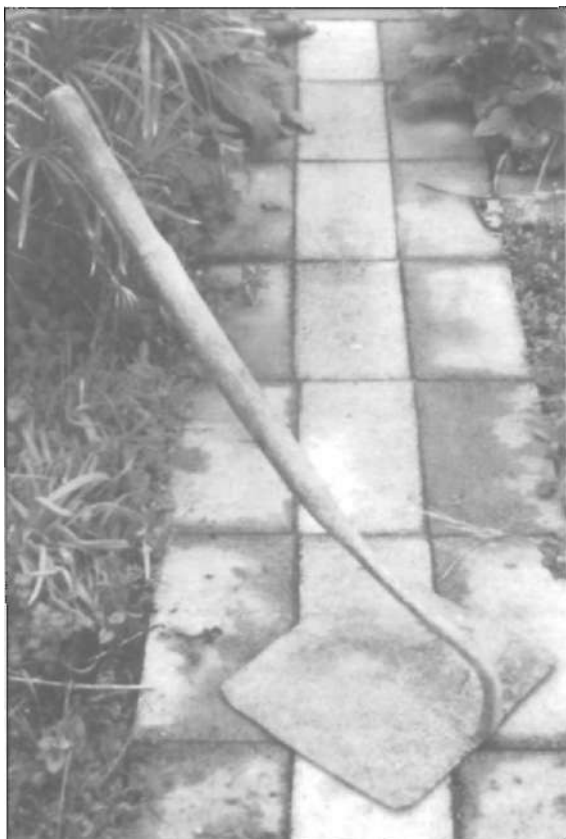
Lligona gran de fumigar la terra. Ha estat utilitzada pels llauradors fins la dècada dels cinquanta.

Cada dia transitaven els carros dels marjalencs. Carros de sorra baixa, i una gran vela cobrint tota la caixa. Davall dels arquets de la vela, asseguts en una cadira de boga, en companyia de l'hortolà, viatjaven sovint alguns membres de la mateixa família; pares, fills, la muller o tots junts. El carro era arrossegat sempre per un vigorós rossí.