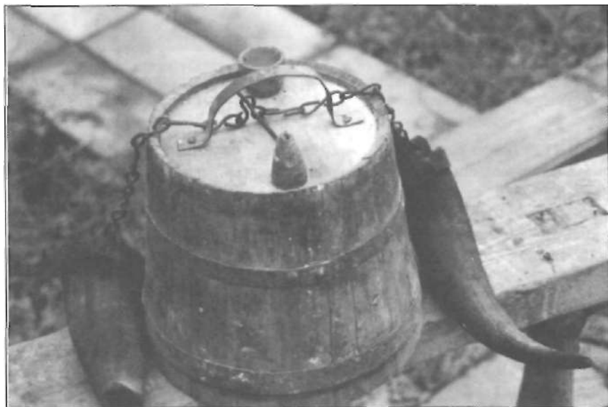
Tonellet d'aigua i vanyes per a ficar l'oli i el vi amb que s'hi provisionaven els llauradors per anar al secà.