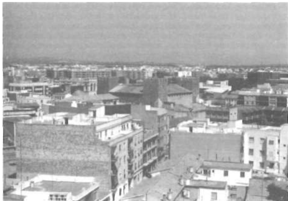
Vista general del Castell-Palau d'Alaquàs.

que «Las Provincias» per a 1897 marcava les pautes de l'excursió i descrivia el monument de la següent manera 4 : «El castillo de Alacuás, que primero perteneció a la familia Aguilar, de origen castellano, y después a sus deudos, los Aznar Pardo de la Casta, de prosapia aragonesa, presenta el tipo exacto, exterior e interiormente, de una mansión señorial de la centuria décimoquinta. Situada en medio del pueblo, aislado por todas partes, si bien unido a la iglesia parroquial por una galeria cubierta, en testimonio del derecho de patronato ejercido por sus antiguos dueños, con amplia portada, severo claustro gótico, despejada esca/era y espaciosas salas, cubiertas de ricos artesonados y flanqueadas por ventanas elegantes; aunque no tiene el brillo histórico que da la tradición al castillo de Benisanó, prisión de Francisco I, le supera en magnitud y belleza de proporciones. Es de lamentar que no se le restaure y se le de un destino más digno, pues en la actualidad tan solo sirve la parte alta para depósito de cosechas, y de las cuatro torres, a las que se sube por escalera de caracol y en las que se disfruta de hermosa vista, no hay mas que una practicable» 5 . Estudi i