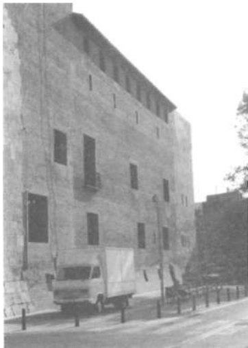
Façana nord del Palau; plaça de la Constitució.

visió notables que finalitzava recomanant «a los excursionistas de Lo Rat-Penat» 6 .