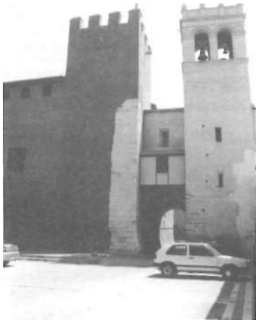
Part de la façana oest del Palau i exterior del cor alt, amb el campanar de l'Església Parroquial de l'Assumpció; plaça del Santíssim.

este país no cabe confiar mas que con la Providencia divina, habrá desaparecido otro vestigio de nuestro gloriosa pasado, con el agravante que no podrá atribuirse la demolición del monumento más que al vergonzoso estado de nuestra decadencia espiritual, ya que en cualquier otro país, y quizás en más de alguna región española, a las horas presentes la mencionada construcción estaría fuera del alcance de la mezquina codicia de los nombres» 12 . Les lamentacions de l'autor eren del tot urgents i realistes. Enllaçaven plenament amb les reivindicacions expressades pels excursionistes de Lo Rat Penat vint anys abans. De fet, a elles acompanyava una sèrie de descripcions artístiques i arquitectòniques que són, si fa no fa, les mateixes que ja havien donat els ratpenatistes en les seues anteriors visites (1880 i 1897) 13 . Finalment, recollia la idea —també decimonònica— de destinar les dependències del Castell a Arxiu del Regne («si en