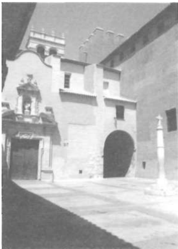
Façana i plaça de l'Església Parroquial de l'Assumpció i part de la façana sud del Palau.

Alaquàs era, sobretot, una «población interesante por su castillo señorial» 8 . I declaraven el seu interès perquè la construcció tinguera una finalitat més digna de la que en aquell moment acomplia. Al cap i a la fi, les seues paraules recollen una iniciativa que havia nascut del propietari del Palau i que durant aquell temps circulà en alguns ambients valencians: ubicar en les seues àmplies sales, «difícilmente se encontrará otro [local] más apropiado para el objeto. La dificultad de la distancia ha desaparecido con el tranvía, que facilita el viaje en pocos minutos» 9 .