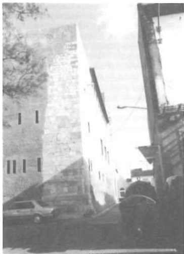
Façana oest del Palau i part de la façana nord.

Palau d'Alaquàs com si estiguera a punt de desaparèixer; i, fins i tot, com si, efectivament, haguera estat abatut ja. Em sembla, aquest, un fet molt significatiu. Indica que, als ulls del redactor, el Castell-Palau només s'havia lliurat momentàniament de la desfeta. L'article, titulat «Monumentos que desaparecen. El castillo de Alacuás», comença, literalment, de la següent manera: «Durante el pasado año de 1918, Valencia ha perdido dos de sus monumentos antiguos, a pesar del buen celo de algunos valencianos, que dieron la voz de alerta, y de las gestiones practicadas por algunas entidades culturales, entre ellas el Centro de Cultura Valenciana» 21 .