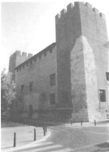
Façana est o principal del Palau i part de la façana nord.

aquell anunci provocà són de les més lloables i fermes que segurament ha protagonitzat mai el nostre poble. La resposta dels valencianistes de l'època fou unànime i contundent.