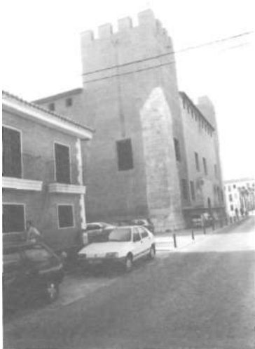
Façana est o principal del Palau i part de la façana sud.

Amb totes aquestes aproximacions, una part de la intel·lectualitat valenciana (notem-ho: la més compromesa en la recuperació cultural autòctona) havia deixat de manifest, a finals del segle XIX, la seua preocupació i interès pel Castell-Palau d'Alaquàs. Doncs bé, foren aquests mateixos personatges i els seus successors els qui, durant el període més crític que ha travessat la història del monument, no dubtaren a alçar la veu, donar el crit d'alarma i realitzar totes les accions possibles perquè el Palau fóra respectat: feren córrer rius de tinta. Vegem per què.