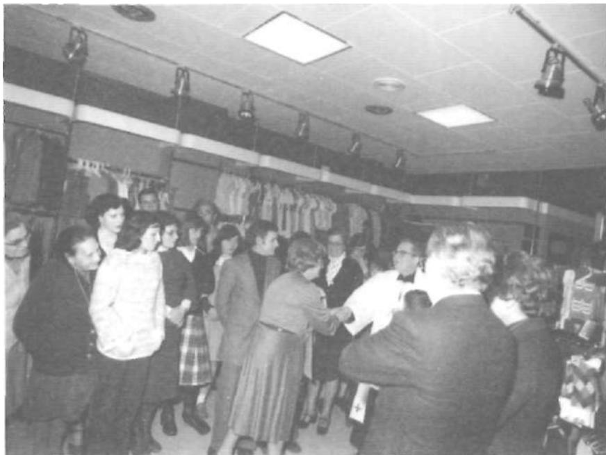
Foto 3. Inauguració de la reforma de Modas Isabel en 1977.

desenvolupament de les idees del seu fill, anà deixant el negoci en les seues mans i s'anà retirant a poc a poc. Ella confesa que el que més li costà de deixar fou el contacte amb les persones, les clientes, que anaven per la tenda, porque diu que les volia molt i les continua volent i son part de la seua vida.