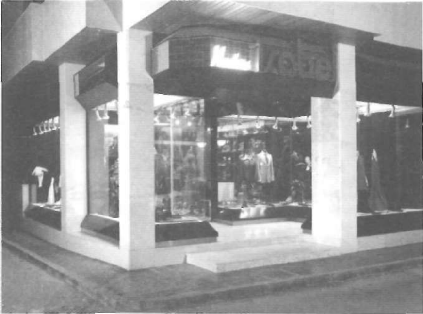
Foto 2. Aspecte de Modas Isabel a partir de 1977.