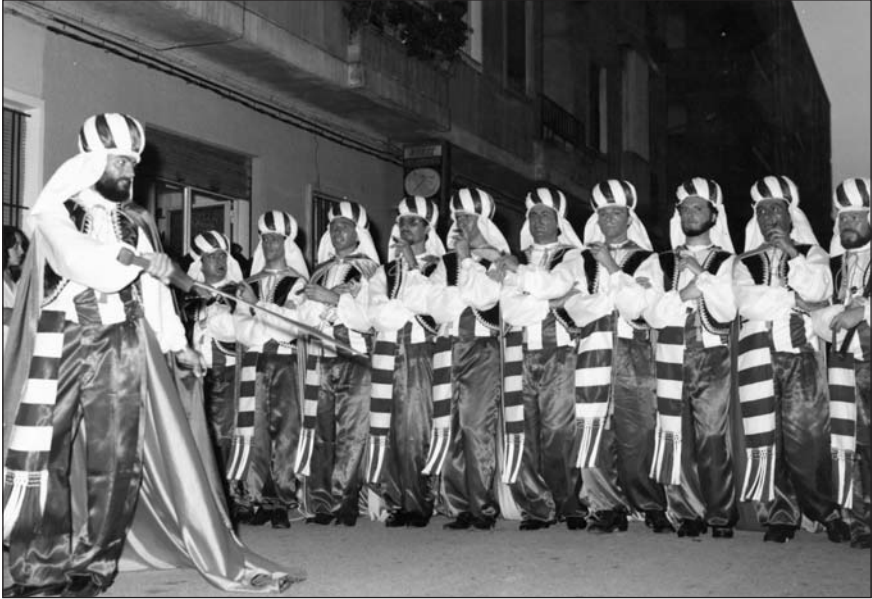
Amb el vestit nou.