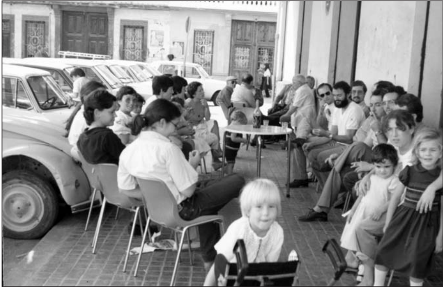
Reunió a la porta de l'Ateneu.

En tornar de Muro, estàvem de tertúlia al Casino de la plaça i recordant emocionats l'experiència murera, es repregué la idea de desfilar.