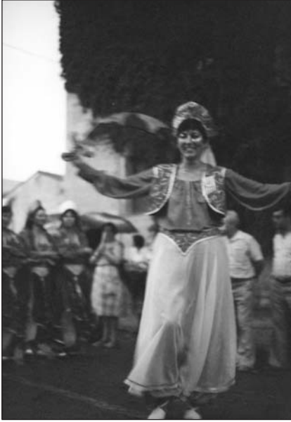
Capitana de la primera filà de mores.

Les dones, brusa i pantalons bombatxos verds, sobrefalda i jupetí blaus. Al cap una coroneta daurada i als peus espadenyes.