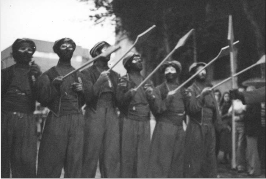
La primera filà de moros