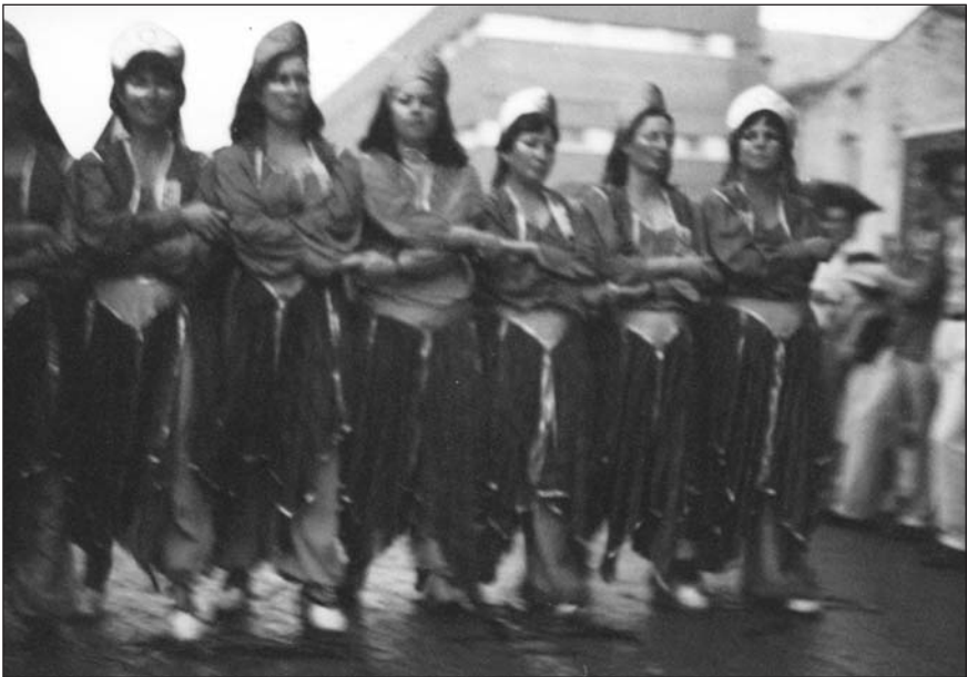
La primera filà de mores.