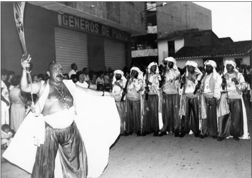
La filà dels paiportins.