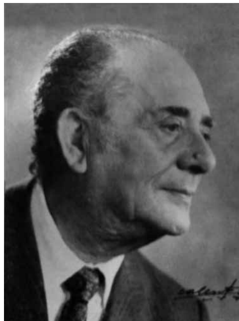
Una imatge de maduresa del poeta Eduard Buil, guardonat amb l'Englantina d'Or.

En setembre de 1920, Eduard Buil Navarro (1898-1973) estava a punt de complir els 22 anys. Originari de València, escrigué novel·la, teatre i poesia. Periodista de professió, l'any 1921 ingressà com a crític teatral en la redacció del diari El Mercantil Valenciano , i dirigí les publicacions Adelante (òrgan del PSOE valencià), Verdad i l'agència España. La seua vinculació política el portà a presidir el Sindicat de Periodistes de l'UGT, i a exiliar-se a l'Alger i el Marroc una vegada finalitzada la guerra civil. Abans, l'any 1920 publicà cinc narracions a El Cuento del Dumenche . Durant la dècada dels anys vint i trenta participà