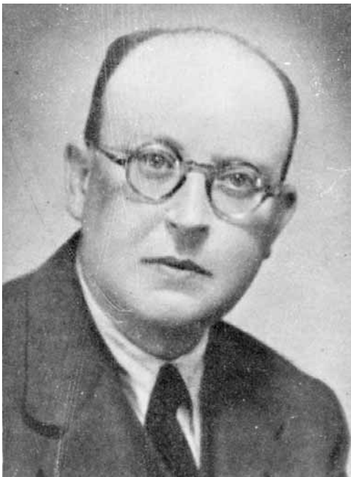
Una imatge de maduresa del poeta Pasqual Asins, guardonat amb la Flor Natural, publicada al volum Poesies (1949).

Joventut Valencianista i a signar les Normes Ortogràfiques de Castelló de la Plana (1932). D'aquesta manera, presidí l'entitat Nostra Parla (un organisme cultural integrat per valencians, catalans i balears que pretenia potenciar l'oficialitat de la llengua 17 ), formà part del Consell directiu de la societat Proa («una altra entitat integradora de tots els corrents valencianistes, units per damunt de les discrepàncies ideològiques de partit, per a la defensa de la llengua» 18 ) i col·laborà en un bon grapat de publicacions periòdiques valencianes, com ara les revistes Taula de Lletres Valencianes i Pensat i Fet . En el setmanari El Camí , posem per cas, tenia al seu càrrec una secció fixa dedicada a l'ensenyament. Per a guanyar-se el pa, treballà com a alt empleat de la Companyia de Tramvies, cosa que no li deixava massa temps per a dedicar-se a la seua vocació lírica. Amb tot, l'any 1941 obtingué la Flor Natural en els Jocs Florals del Rat Penat, fita que representa el cim de la seua dedicació poètica. Finalment, morí el 29 de març de 1948 a Benimaclet. Pocs mesos després de la seua defunció, els qui havien sigut els seus companys i amics a la revista Pensat i Fet editaren, en senyal d'estima i d'homenatge, el volum Poesies (1949), que recull totes les composicions integrades a