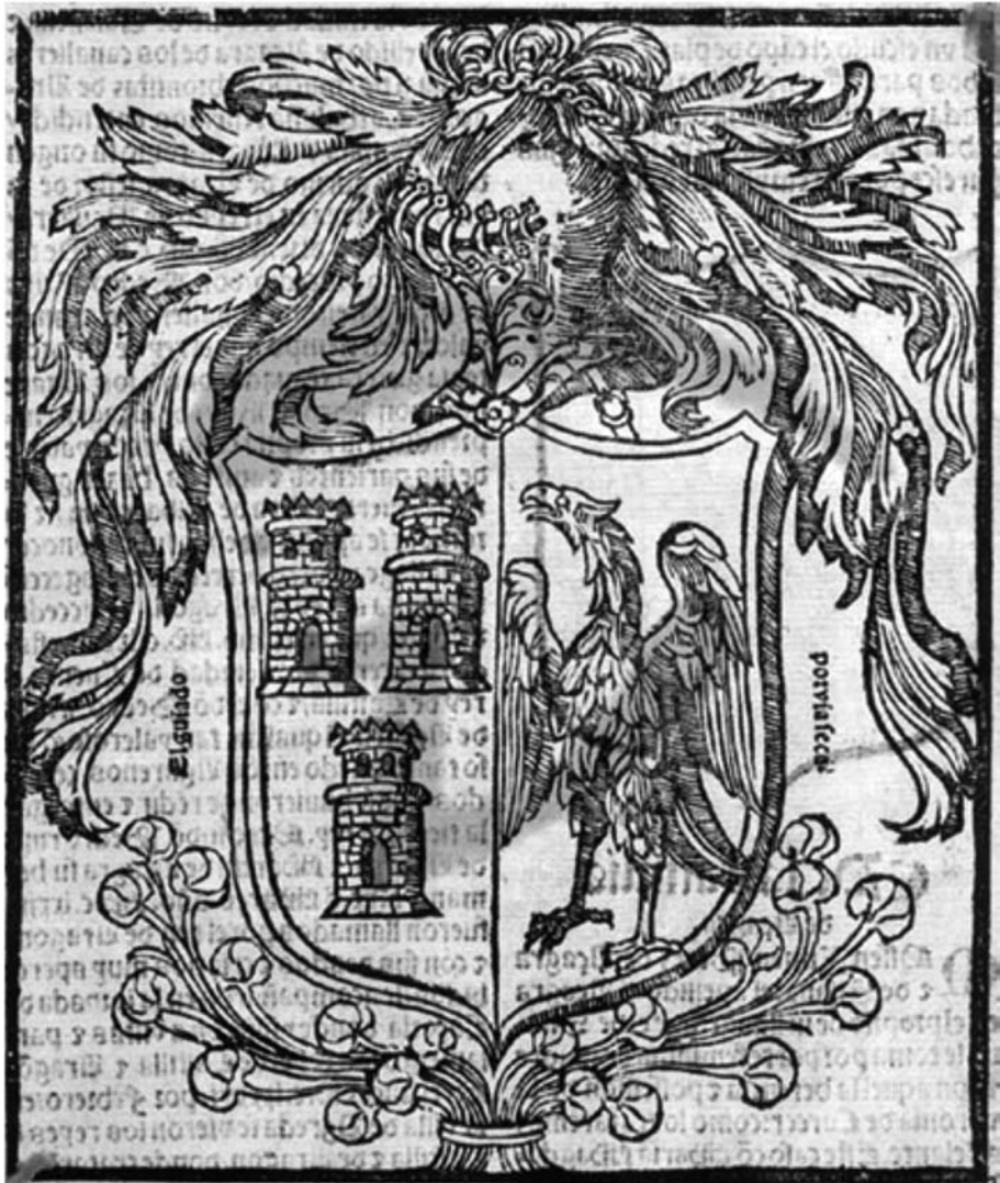
Armas del linaje Martí de Torres de Aguilar. Con el lema "Mal va el guiado por via ciega". Leyendo la planta de malva situada al pié del escudo y el texto de los lados.