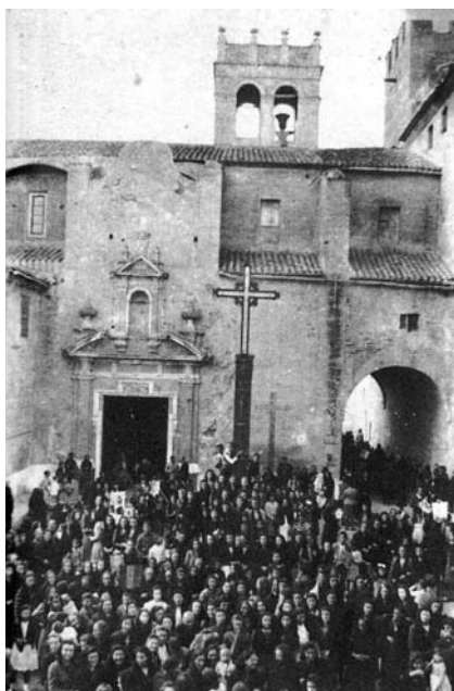
Foto feta l'any 1942, des de la placeta de la Creu, en la qual podem veure al campanar, la campana "grossa" dreta.

Entre vol i vol, les campanes es deixaven alçades (cap per amunt), subjectades per una corda o una estaca de fusta, des del "mamperlat" o mamperlà 8 fins als "espàrrecs" 9 de la "truja" 10 de la campana. La raó de deixar-les "alçades", era, en primer lloc, per la comoditat de no haver d'alçar-les cada vegada que s'anara a començar un vol, per l'esforç que açò suposava, i per una altra banda perquè les campanes alçades s'atribuïen a senyal de festa.