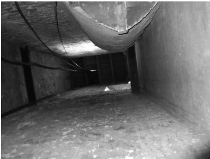
Pou pel qual baixaven les cordes de repic i les peses del rellotge. Passaven per la porteta que es veu al sostre, per on actualment passen els cables de l'electricitat de les campanes

L'únic toc que canviava respecte als dies laborables era el de missa, que consistia en unes batallades més o menys ràpides, en el transcurs aproximat d'un minut, amb la campana major. En acabar aquestes, se'n feien una, dues o tres més segons l'avís que fóra. Aquest toc, a l'igual que altres com els d'oració, els de l'Alçar a Déu o els de Rosari, es feia des de la base del campanar, on penjaven les cordes enganxades al "peçonet" 5 dels batalls de les campanes, per estalviar-se pujar i baixar del campanar per fer tocs tant senzills com aquests.