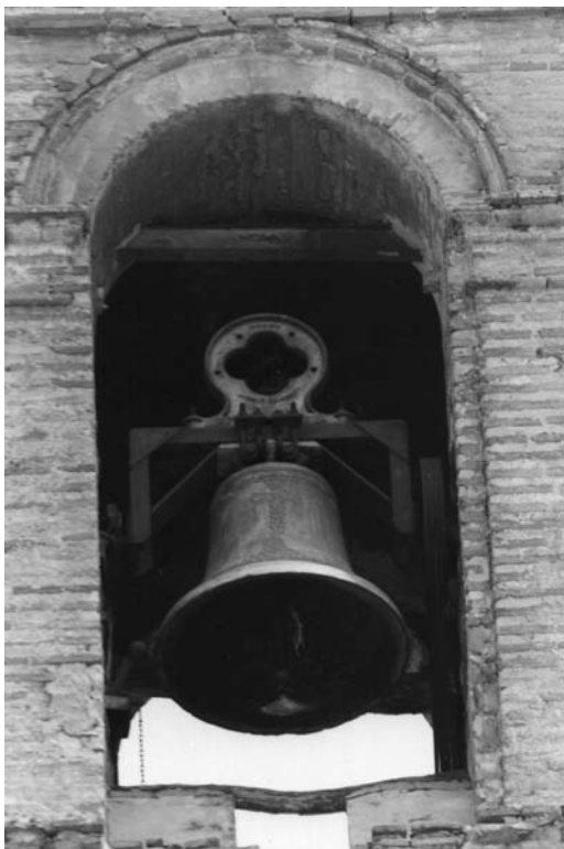
La grossa electrificada amb truja Roses.