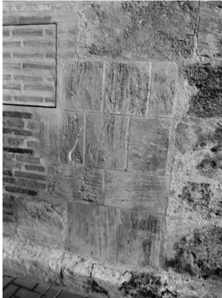
Encara es pot observar pel to de la pedra l'antic accés al campanar.

donar-li corda al rellotge com després veurem-, responsabilitat de les autoritats municipals. Aquesta porta fou tapiada en la restauració del campanar als anys noranta, però encara s'hi veu la marca amb pedra nova.