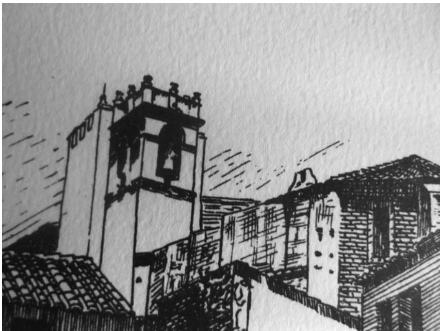
En aquest dibuix, fet per Ramon Cosme l'any 1984, es pot veure clarament l'espadaña del "cimboriet"

A les dotze del migdia s'efectuava el conegut toc de l'Àngelus, també anomenat a alguns pobles de la nostra comarca "les batallades del migdia". A l'igual que el toc de l'Alba, consistia en tres batallades de la campana "grossa", separades per una Ave Maria. En sentir aquestes, era costum que els treballadors dels diferents oficis pararen per fer un guanyat descans, i que la gent resara una Ave Maria.