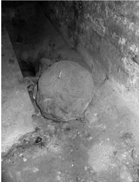
Conservació de la pesa de l'antiga maquinària del rellotge