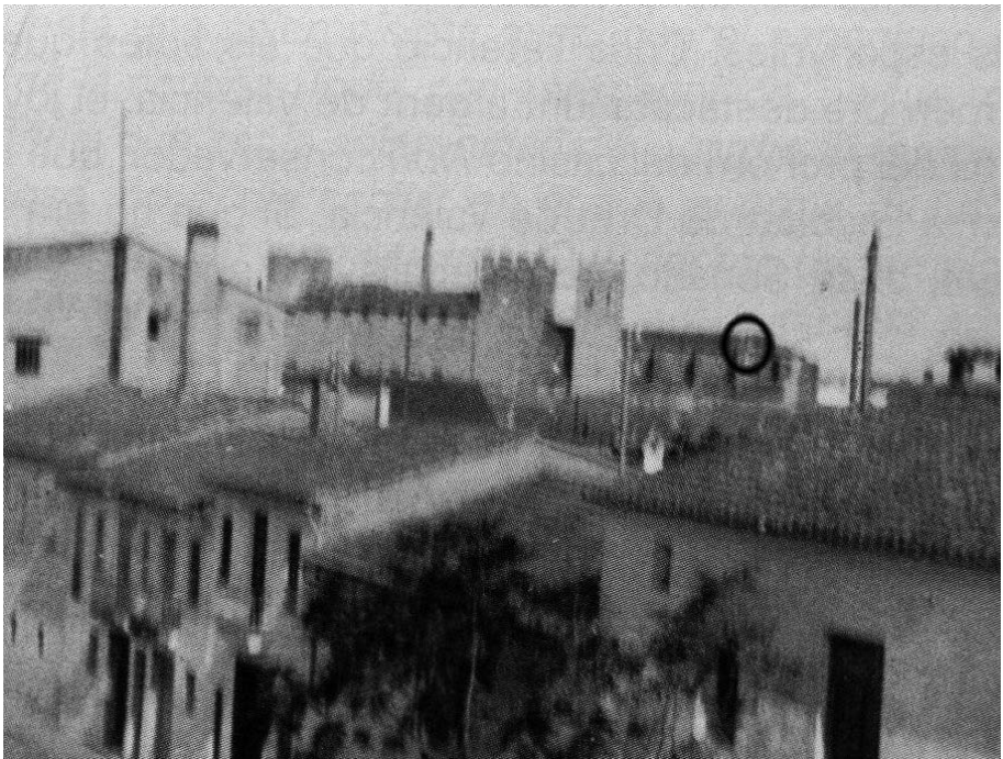
Amb el cercle indique el lloc on difusament s'aprecia l'espadanya del "cimboriet". Foto feta l'any 1920

Tenia una doble funció: la primera era la de fer els tocs diaris sense haver de pujar al campanar; i la segona era la d'avisar els campaners els dies de festa major, en els diferents moments de la missa en què havien de tocar (glòria, sermó, "Alçar a Déu" i final), ja que no hi havia un altre mitjà per poder seguir la missa, i per això, en molts llocs a aquest tipus de campanes els anomenaven les "senyaleres".