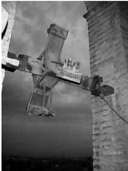
La matraca d'Aldaia

Al nostre poble veí, Aldaia, al campanar de l'església de l'Anunciació n'hi ha una, ubicada a la finestra dreta del carrer major, i fàcilment visible des del carrer.